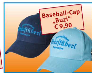
Baseball-Cap „Buzi“ € 9,90