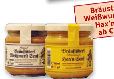
Bräustüberl Weißwurst oder Hax'n'Senf ab € 2,90