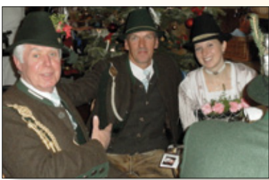
Der Weihnachtstrunk der Gebirgsschützen im Bräustüberl hat Tradition. Am 24.12.2011 war es wieder soweit!

Souvenirs für daheim gibt's in unserem Bräulad'l, nur ein paar Schritte von hier