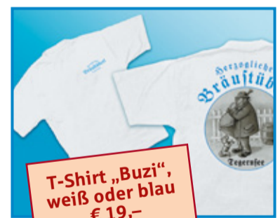
T-Shirt „Buzi“, weiß oder blau € 19,-