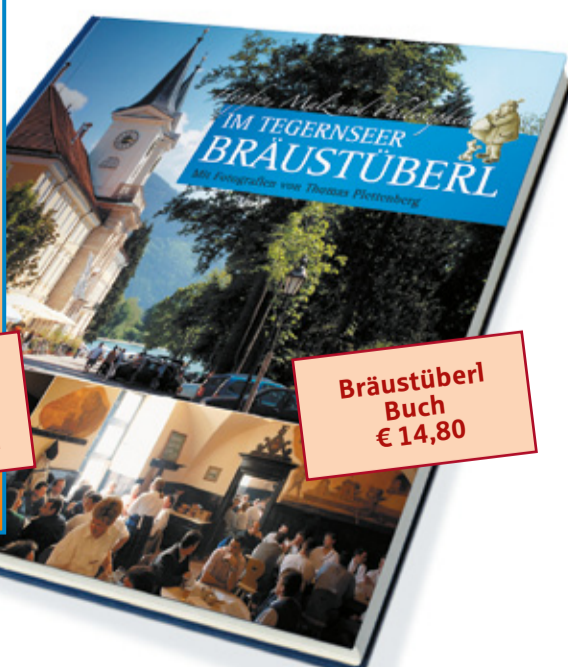
Bräustüberl Buch € 14,80