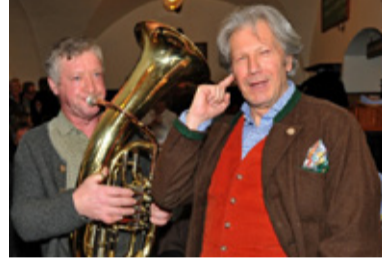
Neuzugang: Schauspieler Bernd Herzsprung