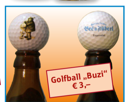
Golfball „Buzi“ € 3,-