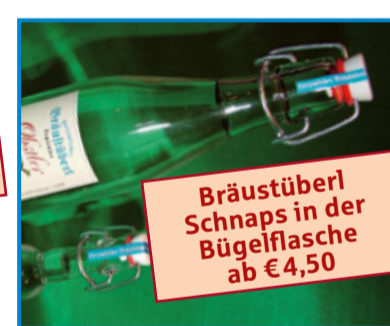
Bräustüberl Schnaps in der Bügelflasche ab € 4,50