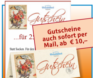
Gutscheine auch sofort per Mail, ab € 10,-