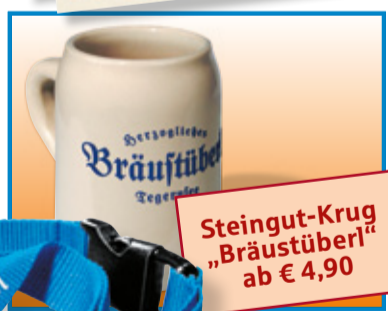
Steingut-Krug „Bräustüberl“ ab € 4,90