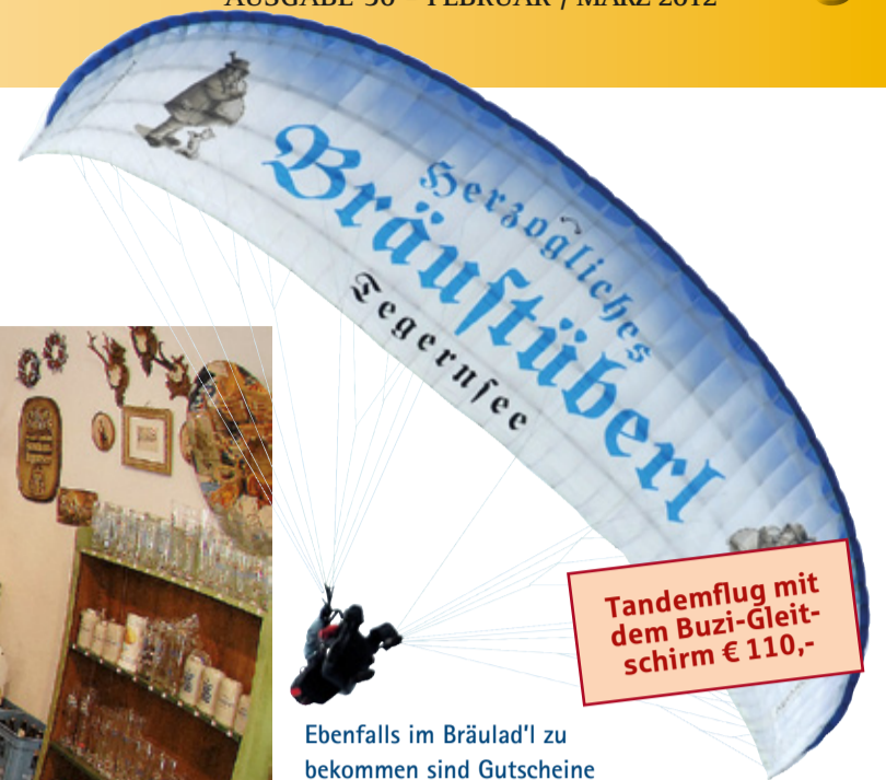
Tandemflug mit dem Buzi-Gleitschirm € 110,-