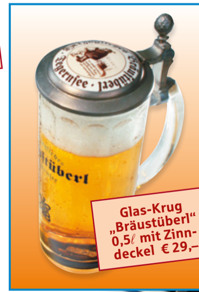
Glas-Krug „Bräustüberl“ 0,5l mit Zinn-deckel € 29,-

2-4 Zimmer-Luxus-Wohnungen in topsaniertem Altbau Traumhafte u. lichtdurchfl. Wohnungen zw. 64 m² u. 128 m², teilw. Seeblick, exkl. Wohnatmosphäre durch hochw. Ausst., Lift, Balkon bzw. Terrasse, Garagen, KfW 70, massive Ziegelbauweise, erstkl. Infrastruktur – grün, stadtnah, attraktiv – Eine sichere Investition in die Zukunft! Wohnungsbeispiele: 2-Zi-Whg, 78 m² Wfl., 1. OG, gr. Süd-Balkon 280.000,- € 2-Zi-Whg, 88 m² Wfl., Dachgeschoss, Balkon 440.000,- € 3-Zi-Loft-Garten-Whg, 121 m² Wfl., Raumhöhe ca. 3 m, Süd-Terrasse + Gartenanteil 360.000,- € Ein Projekt der Dr. Schmidt wohnen Immobilien Fritz N. Osterried Tel. 089/419 482-0