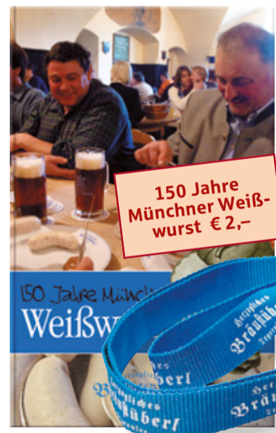
150 Jahre Münchner Weißwurst € 2,-