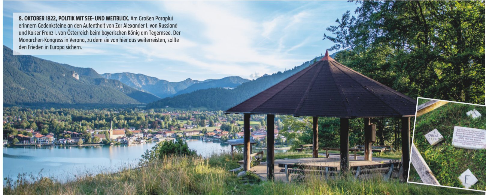
8. OKTOBER 1822, POLITIK MIT SEE- UND WEITBLICK. Am Großen Paraplui erinnern Gedenksteine an den Aufenthalt von Zar Alexander I. von Russland und Kaiser Franz I. von Österreich beim bayerischen König am Tegernsee. Der Monarchen-Kongress in Verona, zu dem sie von hier aus weiterreisten, sollte den Frieden in Europa sichern.

Vor 200 Jahren trafen sich europäische Herrscher im Tegernseer Schloss