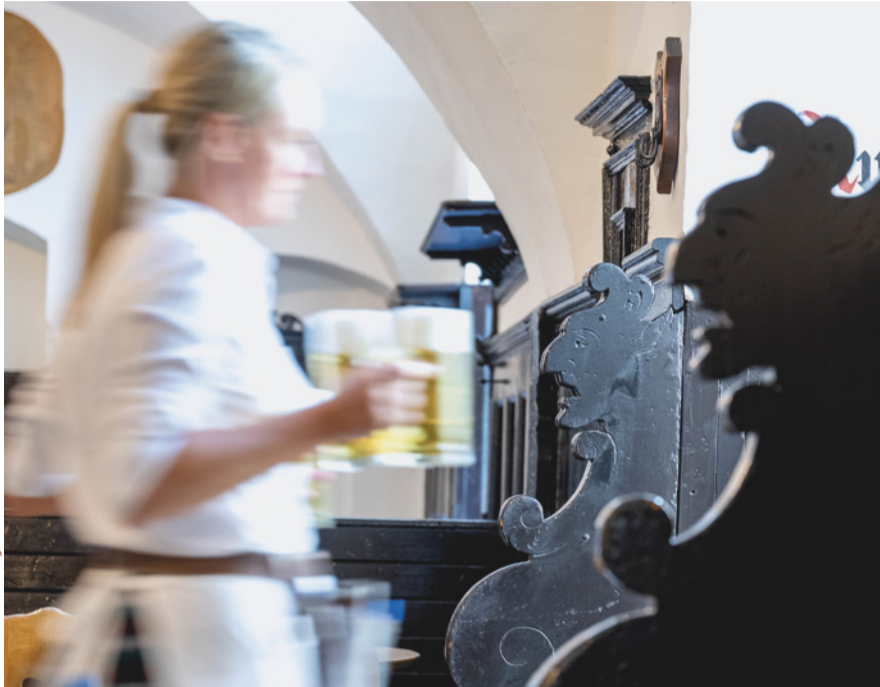
Beißen nicht und naschen auch nicht vom Teller. Aber vielleicht passen die Bankhexen auf, dass nur nette Leut' ins Bräustüberl hineinkommen?!

Damen unter unseren Gewölben eingefunden haben, lässt sich nicht mehr feststellen. Und welcher gut aufgelegte Möbelbauer sein Schnitzmesser gezückt hat, leider ebenso wenig. Ein Hingucker aber sind die Bankhexen vom Bräustüberl allemal. Wer sie kennenlernen will: Zwei bewachen den Haupteingang, eine ist an einer Bank im Raum vor der Schank zu finden.