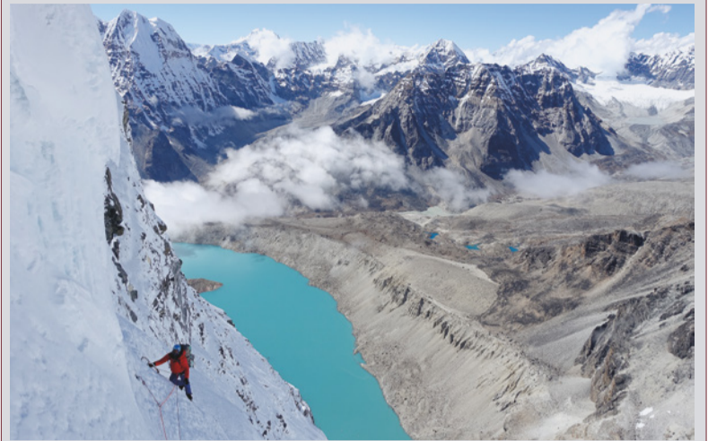
Foto: Aus dem Film „L'ombre du Chamlang“ von Jérémie Chenal, Frankreich