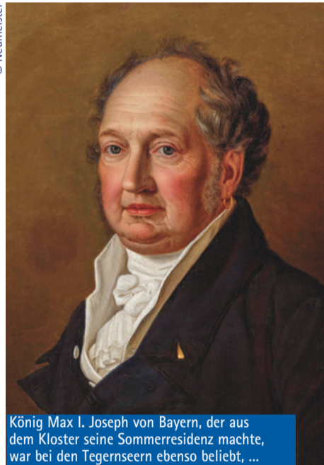
König Max I. Joseph von Bayern, der aus dem Kloster seine Sommerresidenz machte, war bei den Tegernseern ebenso beliebt, ...