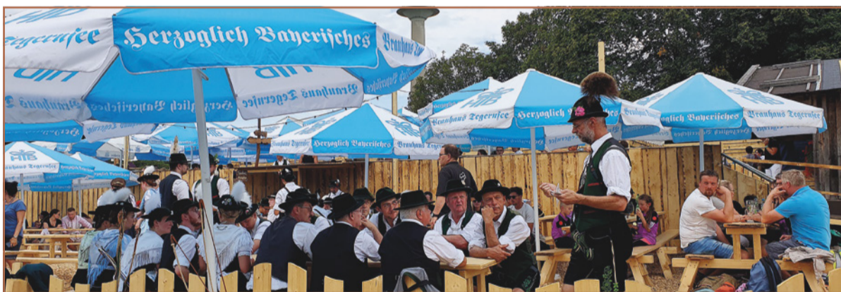
Die European Championships Munich 2022 (ECM) waren das größte Sportereignis Münchens der letzten 50 Jahre – und wir waren dabei. Das Bräustüberl unterstützte den Tegernseer Biergarten auf dem „Heimat Roof“. Hier fand u.a. die offizielle Eröffnungs-Pressekonferenz mit über 80 nationalen und internationalen Journalisten statt.

Wir schreiben keinem vor, ob sein Fahrzeug durch 50 oder 500