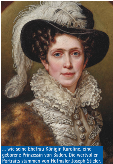
... wie seine Ehefrau Königin Karoline, eine geborene Prinzessin von Baden. Die wertvollen Portraits stammen von Hofmaler Joseph Stieler.

Allerdings löste die Ankündigung, dass das österreichische Kaiserpaar und der Zar auf dem Weg nach Verona nach Tegernsee kommen würden, beim König gemischte Gefühle aus. An den Kronprinzen schrieb er: „Stellen Sie sich meine Freude vor, aber auch meine Verlegenheit, alle diese Leute unterzubringen.“ Es ging ja – einschließlich des üblichen Gefolges aus Ministern, Diplomaten, Beamten und Dienerschaft – um mehr als 250 Personen.